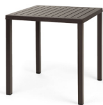
CAFFÈ vern. caffè 47857.05.000