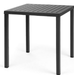
ANTRACITE vern. antracite 47852.02.000