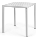
BIANCO vern. bianco 47853.00.000

PT Mesa empilhável 70x70 cm. Material: tampo DurelTOP em polipropileno com tratamento anti-UV colorido na totalidade. Pernas em alumínio pintado. Acabamento fosco. Pés ajustáveis. Resina reciclável.