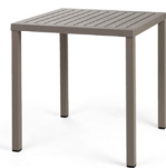
TORTORA vern. tortora 47859.10.000